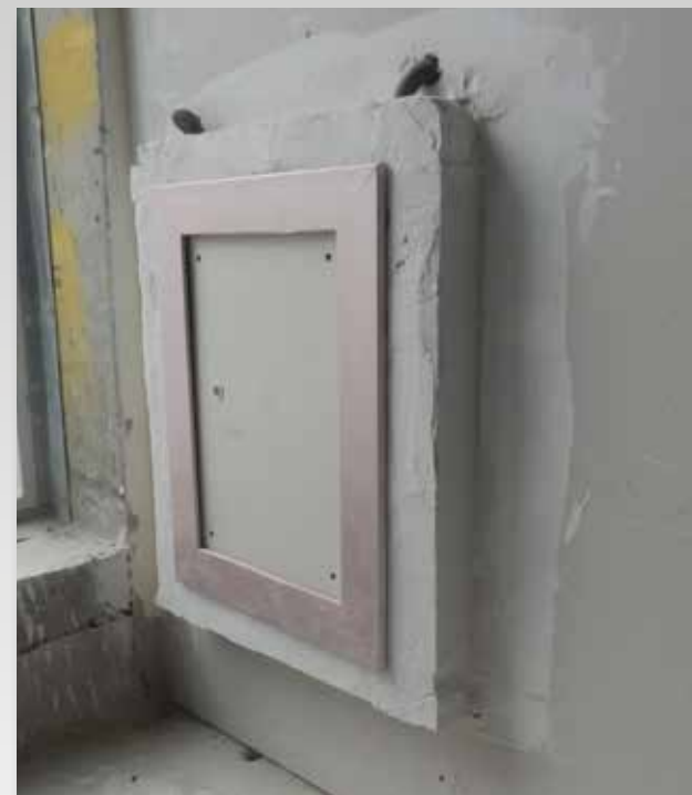
Avant la décoration

Finition KAMOUFLAGE standard + option primaire sur le cadre